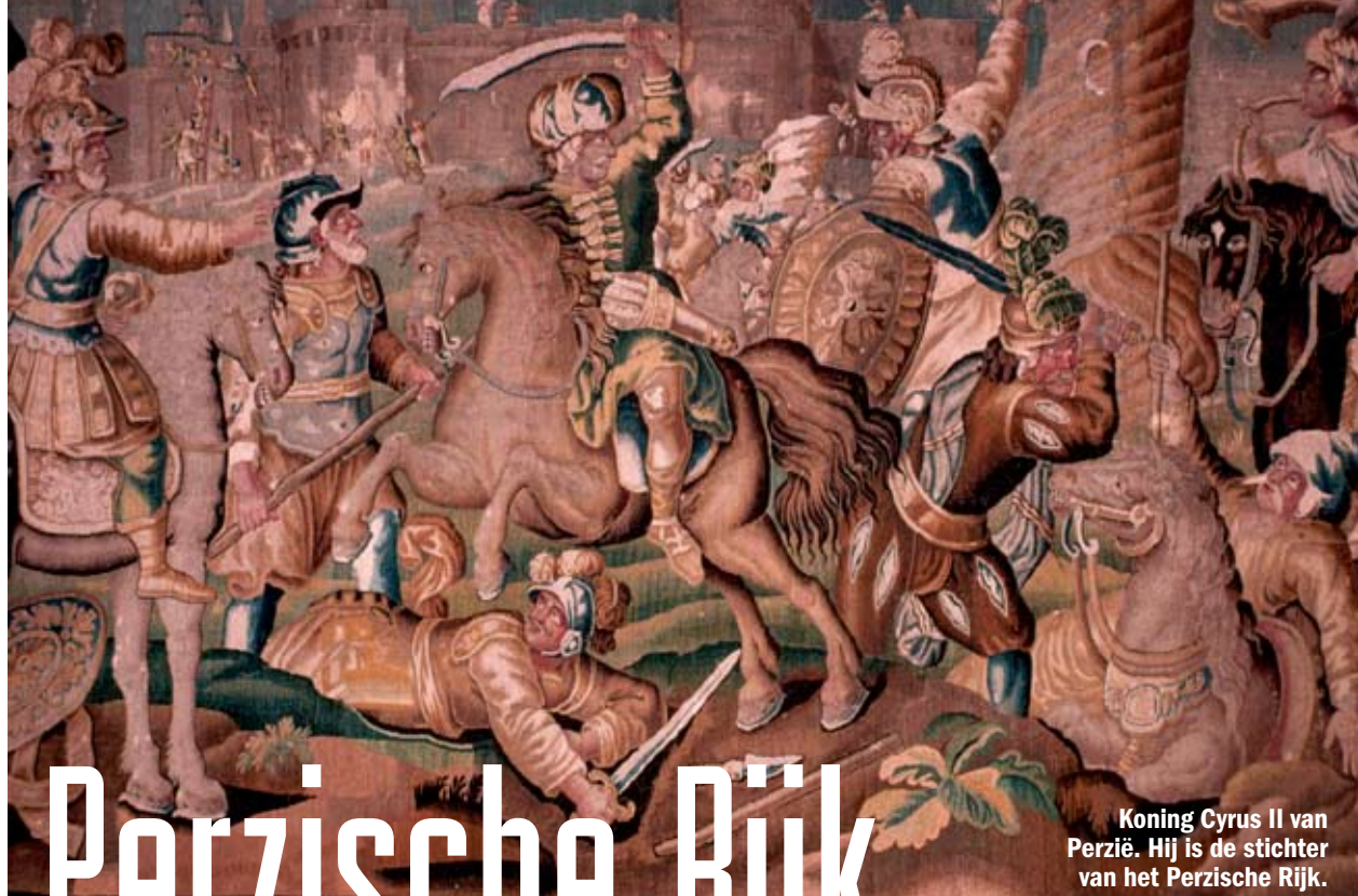
Koning Cyrus II van Perzië. Hij is de stichter van het Perzische Rijk.